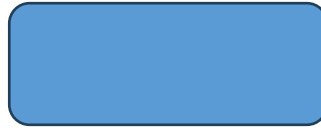
Foto1. Nombre y Apellido del estudiante y que realizó